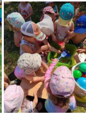
День Семьи в группе “Лучики” 08.07.2024