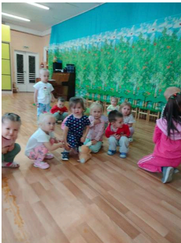
Развлечение “День Нептуна” в ранней группе “Лучики”. 04.07.2024