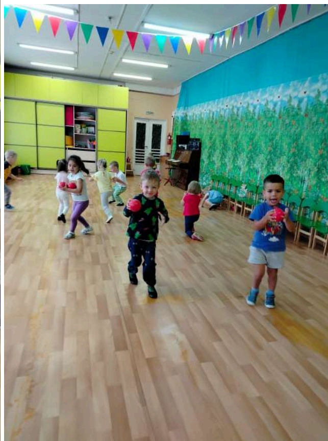
Спортивное развлечение “Путешествие в лес” 17.06.2024 группа 1,5-3 года