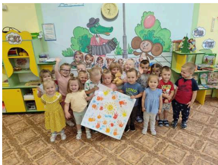
“День рождения Светофора” в ранней группе 1,5-3г. 05.08.2024