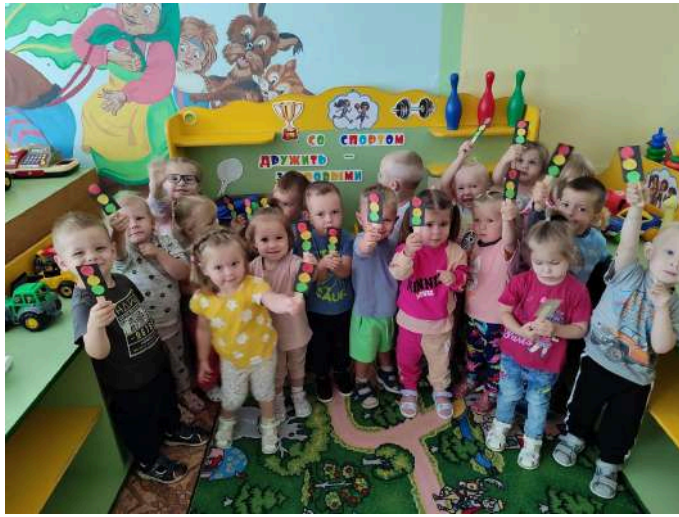
08.08.2024 Международный день кошек в группе “Лучики”.