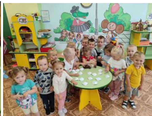
09.08.2024 День книголюба в ранней группе 1,5-3г