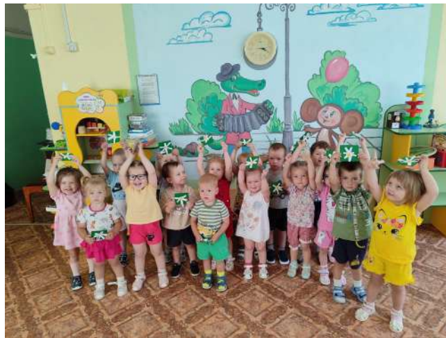
“День Дружбы” в ранней группе “Лучики “ 30.07.2024